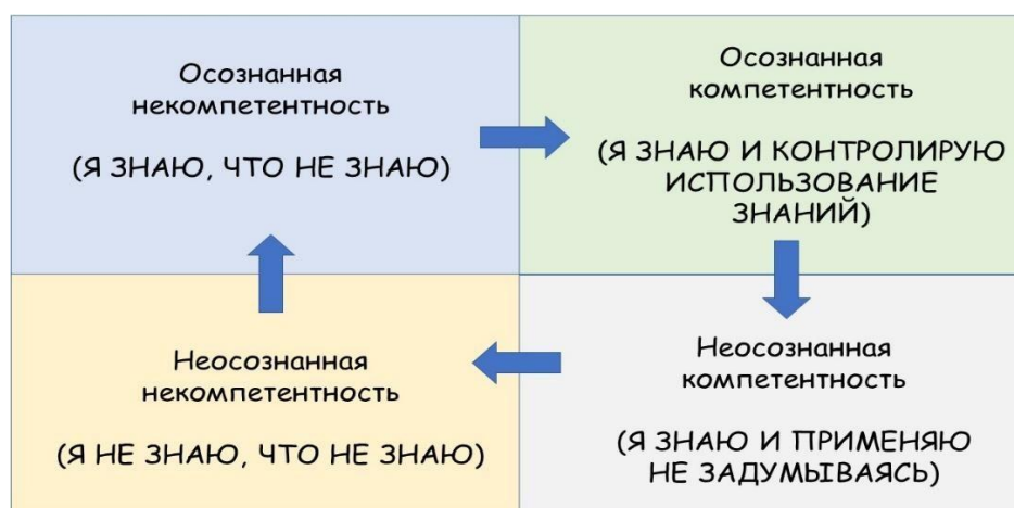
Рис. 3. Переход от бессознательной некомпетентности к бессознательной компетентности

Этот четырехступенчатый процесс представляет собой переход от бессознательной некомпетентности к бессознательной компетентности [1].