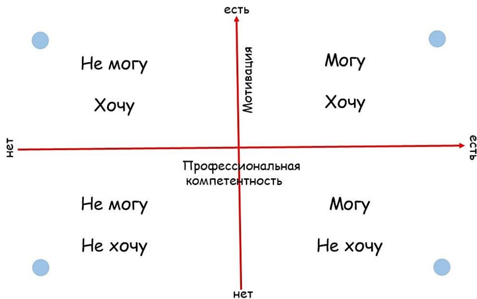
Рис. 2. Готовность молодого специалиста к работе

(на основе модели ситуационного руководства Херси-Бланшара)